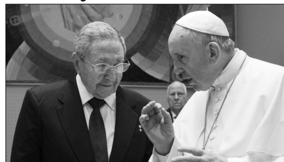
El presidente cubano, Raúl Castro conversa con el Papa Francisco durante una audiencia privada en el Vaticano el 10 de mayo

Castro dijo que salió de su reunión con el papa “muy